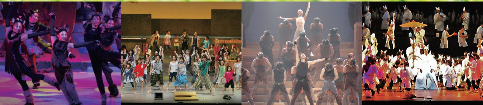
これまでの公演の写真